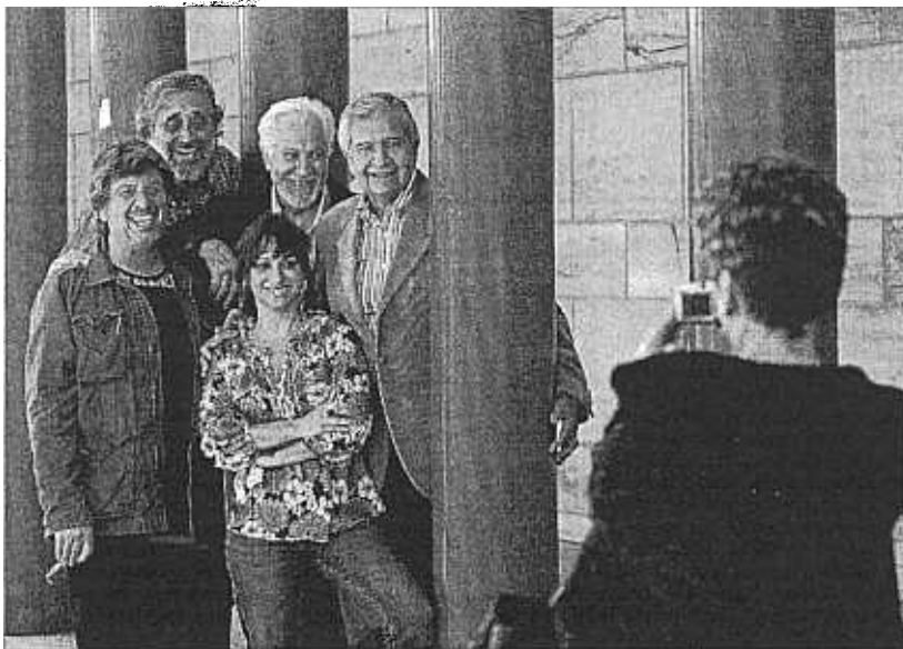
El director, el autor y los actores de la obra posan ayer en los exteriores del Palacio de Festivales.